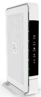
Genexis Pure Modell: ED500